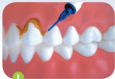
Auftragen auf den Zahnhals

Tragen Sie mithilfe einer stumpfen Nadel eine dünne Schicht auf die Zahnoberflächen auf, die mit der Zahnbürste nur schwer oder gar nicht zu erreichen sind. Vermeiden Sie den Kontakt des Chlorhexidin-Zahnlacks mit der Zunge. Verwenden Sie bei Anwendung des Chlorhexidin-Zahnlacks von Biodent nicht mehr als \frac{1}{4} der Spritzenfüllung je Anwendung.