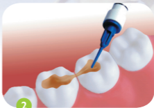
Auftragen auf die Kauflächen