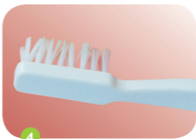
5 Minuten lang nichts essen oder trinken und danach den Zahnlack mit einer Zahnbürste entfernen. Kleine Stückchen ausspucken.